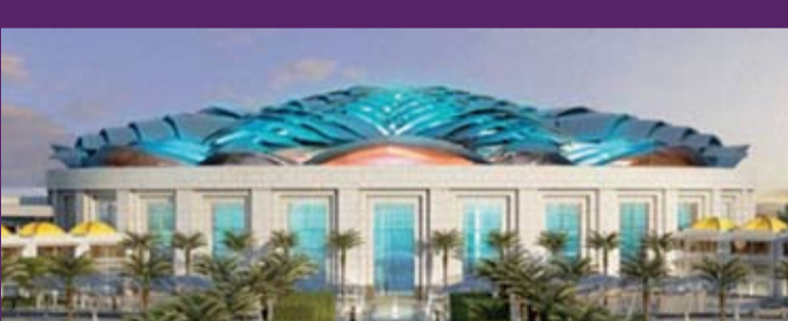
مركز عمان للمعارض والمؤتمرات

على حد سواء كمؤسسة وكفرد، اعتقد أن المرافق التي نقوم بتطويرها وإدارتها تقدم مساهمة إيجابية في التأثير على النتائج المستدامة للسياحة والمجتمع ككل.